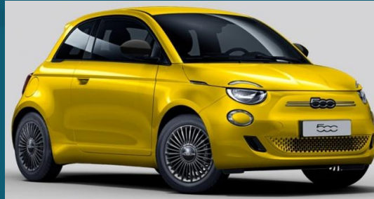
Sun Of Italy Yellow (554)