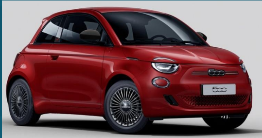
Passione Red (111)