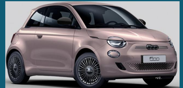
Rosé Gold (237)