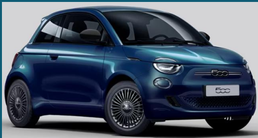
Ocean Green (230)