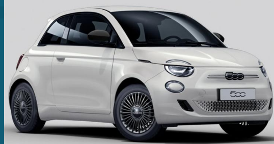
Ice White (268)