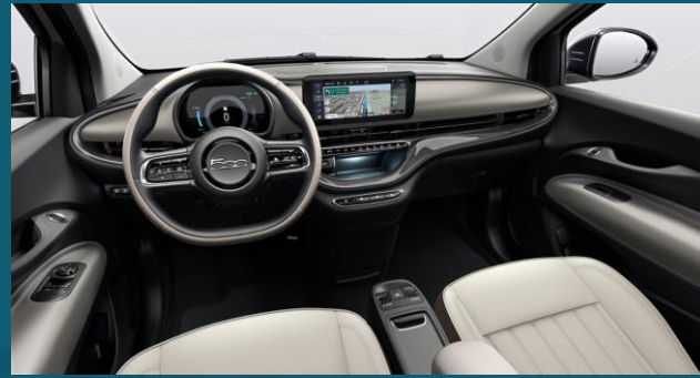
Eco-Läder "Canelloni" Beige