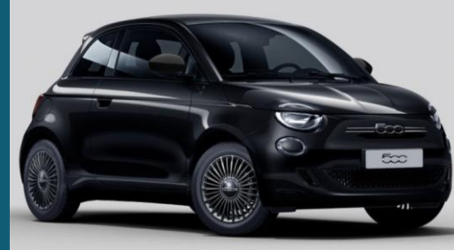
Onyx Black (601)