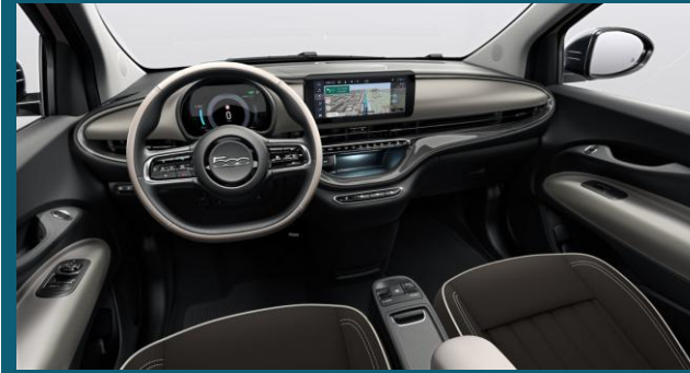
Eco-Läder "Canelloni" Chocolate