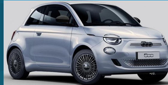
Celestial Blue (252)