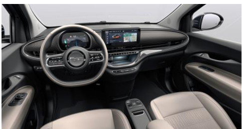
PREMIUM WHITE SOFT TOUCH (845) SE FÄRGMATRIS FÖR CABRIOLET