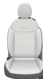
SOFT-TOUCH, PREMIUM WHITE