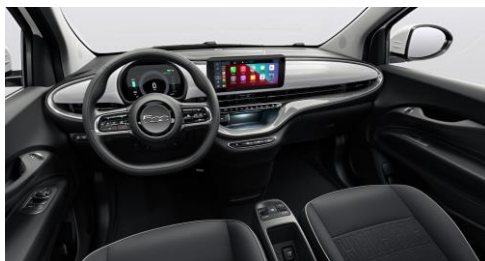
SVART, MED INSTRUMENTBRÄDA LACKAD I SVART (573)