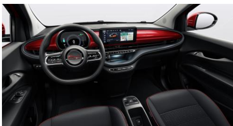
SVART, MED INSTRUMENTBRÄDA LACKAD I RÖD FÄRG (330)