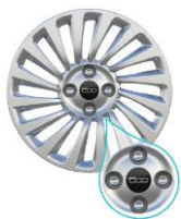
15" STÅLFÄLGAR (NAVKAPSLAR)